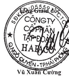
Vũ Xuân Cường